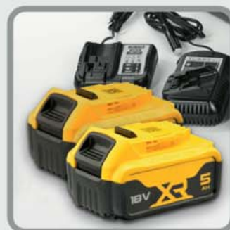
Akku-Set (groß) 18 Volt / 5 Ah für eine Laufzeit von ca. 8,5 Stunden und ca. 500 Röntgenauf- nahmen (0,62 kg/Akku)