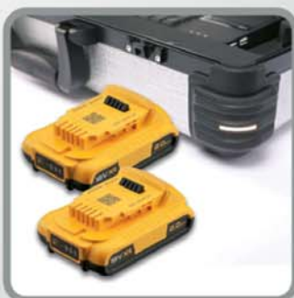
Akku-Set (klein) 18 Volt / 2 Ah für eine Laufzeit von ca. 3,5 Stunden und ca. 200 Röntgen- aufnahmen (0,35 kg/Akku)